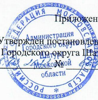
СХЕМА построения праздничного шествия в Городском округе Шатура 09 мая 2023 года

Утвержден постановлением администрации Городского округа Шатура от 20.05.2023 № 10/0102724 Московской области