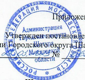
СХЕМА построения праздничного шествия в Городском округе Шатура 09 мая 2023 года

Утвержден постановлением администрации Городского округа Шатура от _____ № _____