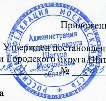
Схема движения колонн 9 мая 2023 года

Приложение 5 Утвержден постановлением администрации Городского округа Шатура от _____ № _____